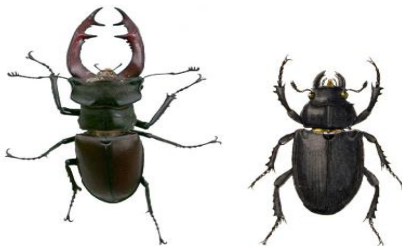
Foto 4.4. Rădașca ( Lucanus cervus ) exemplar mascul- stanga și exemplar femelă- dreapta

Descrierea speciei: Dimensiuni: 35-80 mm. Corp castaniu întunecat până la negru. Dimorfism sexual accentuat. Masculii au capul mai larg decât protoracele, prevăzut cu creste transversale, iar mandibulele lungi până la o treime din lungimea corpului, prevăzute cu dinți, asemănătoare coarnelor de cerb. Femela mai mică are capul mai îngust decât protoracele, iar mandibulele nu depășesc lungimea capului.